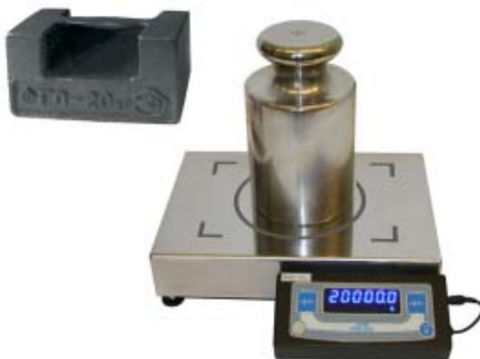
Рисунок 1 – Внешний вид весов ВМ24001 и гирь.

Весы ВМ24001 разработаны и выпускаются ООО «ОКБ Веста» и включены в Госреестр средств измерений Российской Федерации под №36468-07.