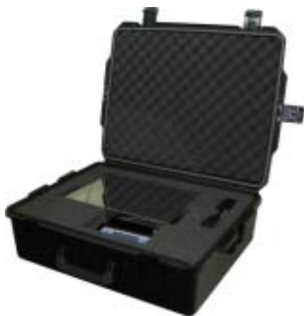
Рисунок 6 - Внешний вид кейса и расположение в нем весов при перевозке.

Если требуется доставить весы к месту проверки гирь, то можно использовать специальный кейс (рис. 6), поставляемый по отдельному заказу.